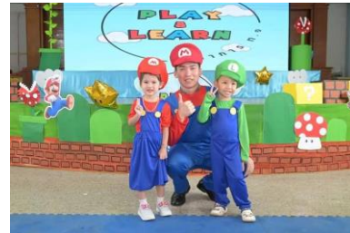
64 Teachers Fighter