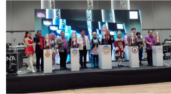
5 Show Stages