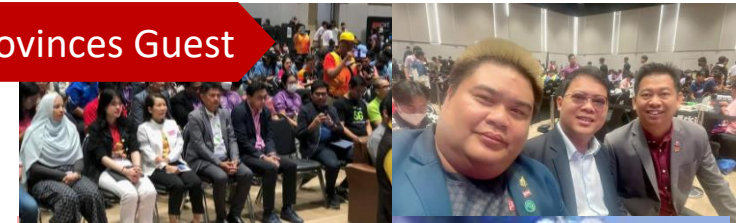
4 Provinces Guest