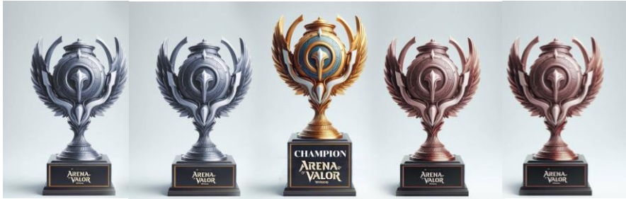
5 Major Trophies