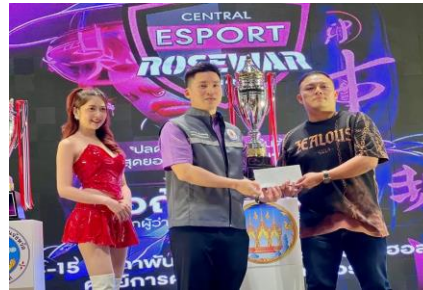
15 Minor Trophies