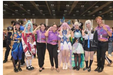
ROV Cosplay & Baby cartoon catwalk