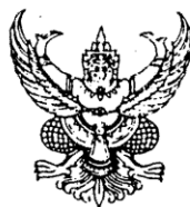
ขนาดตัวครุฑสูง ๓ เซนติเมตร